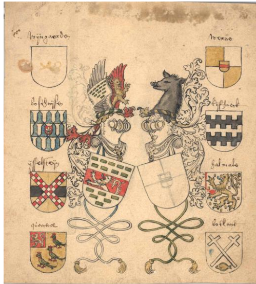
Afb. 1. Wapentekening Oem van Wijngaarden-Van der Werve , Leiden 1560; Hans Liefrinck II, papier 16 x 17,5 cm.