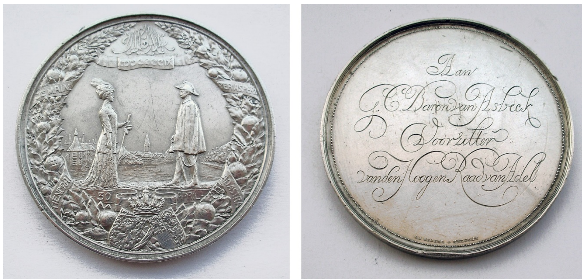
Voor- en achterzijde van de penning, vervaardigd ter gelegenheid van de doop van prinses Juliana in 1909