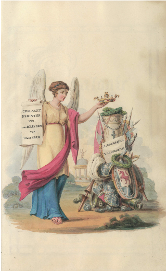
Titelblad van 'Genealogie de la maison De Brien de Ramerus', 1835 (Hoge Raad van Adel, Familiearchief Van Brien van Ramerus, inv.nr. 1).